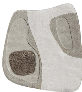
BN 01 Polvere di Limonio | Medium