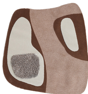
BN 02 Giunco Veneziano | Medium