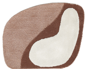
BN 02 Giunco Veneziano | Small