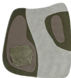
BN 03 Verde Salicornia | Medium