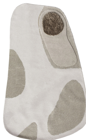
BN 01 Polvere di Limonio | Large

I dati forniti in questa scheda tecnica sono aggiornati al momento della pubblicazione. Carpet Edition si riserva il diritto di modificare materiali, dimensioni e caratteristiche senza preavviso. The data provided in these technical specifications are up to date at the time of publication. Carpet Edition reserves the right to modify materials, sizes and characteristics without notice.