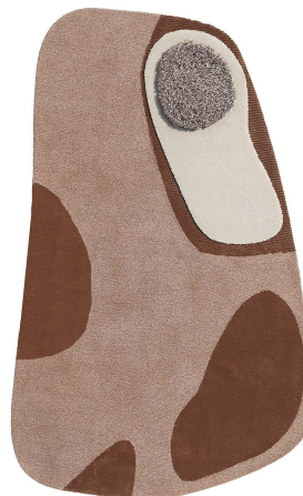
BN 02 Giunco Veneziano | Large