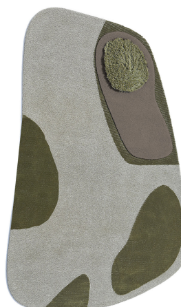
BN 03 Verde Salicornia | Large