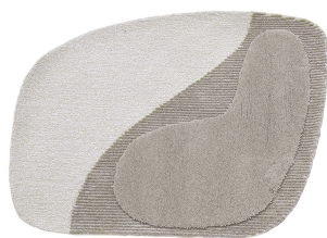
BN 01 Polvere di Limonio | Small

Disponibile su misura Custom sizes available